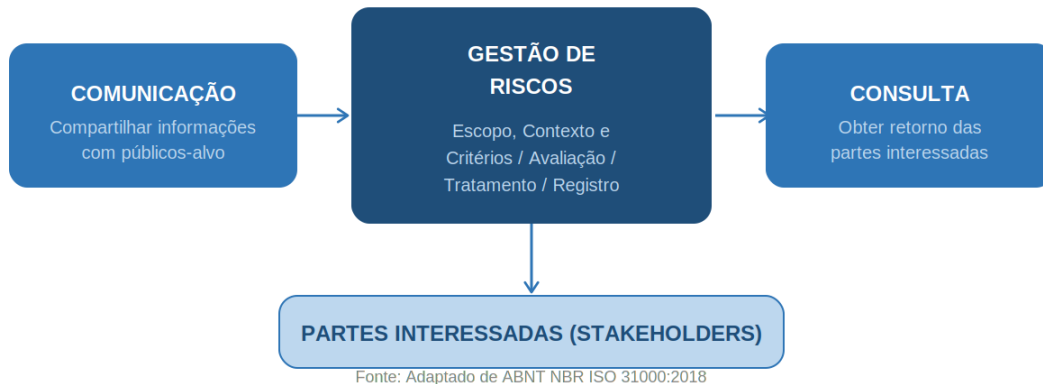
Figura 2 – Processo de "Comunicação e Consulta" na Gestão de Riscos