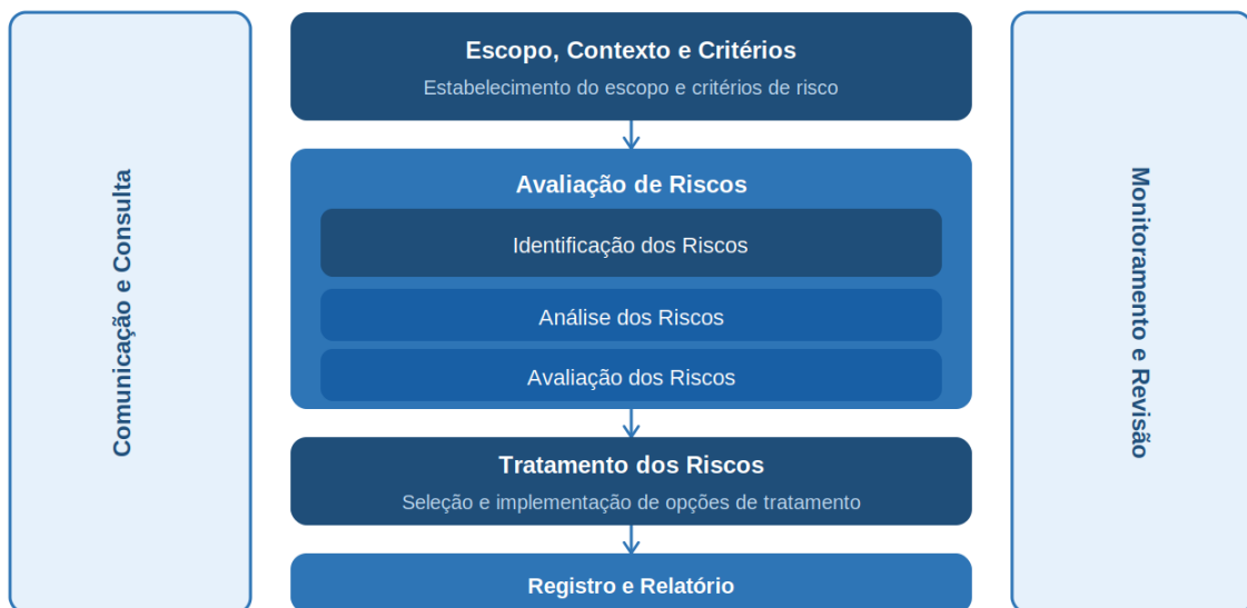
Figura 1 – Processo de Gestão de Riscos (ABNT NBR ISO 31000:2018)